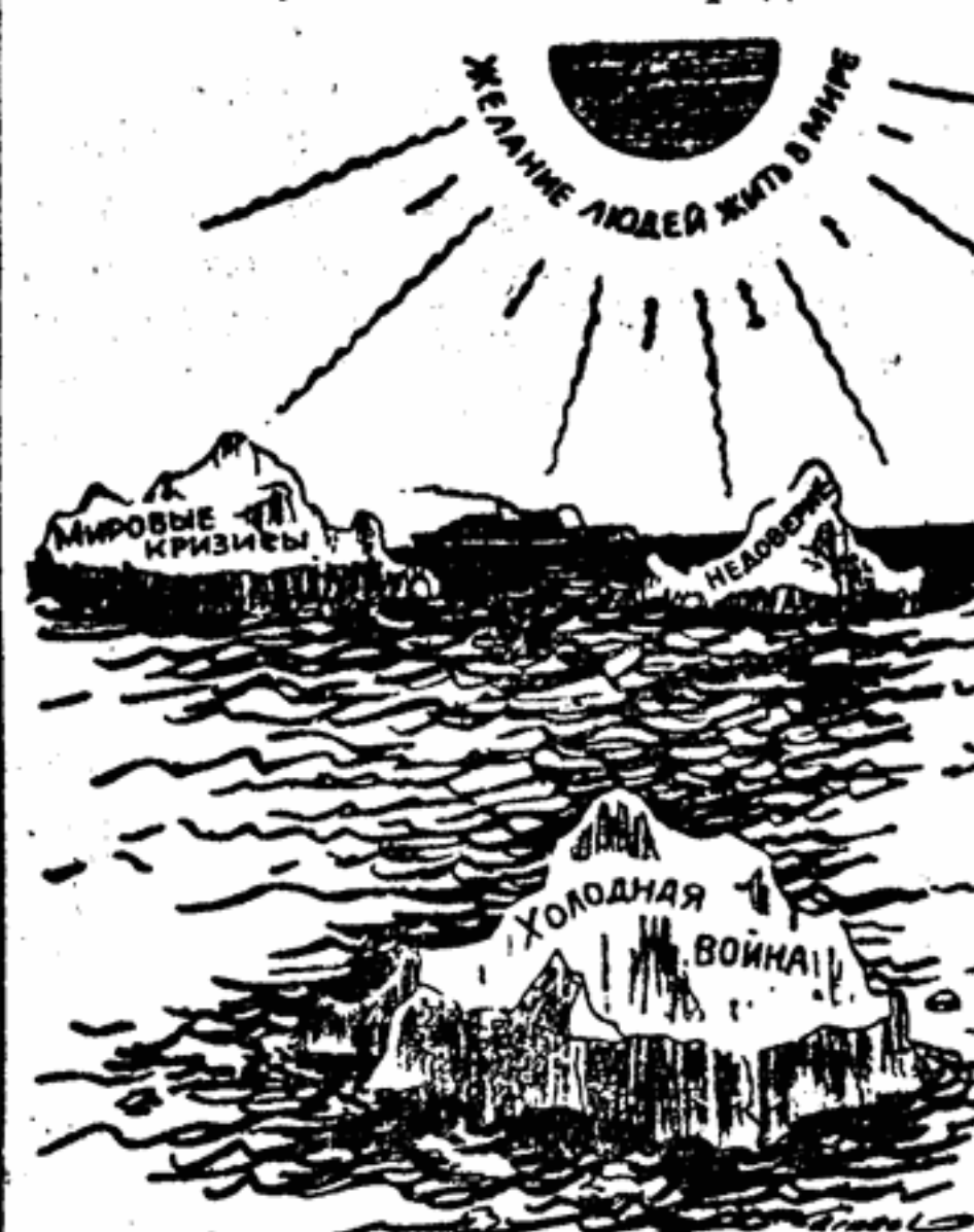
Айсберги могут появляться и исчезать, но... Рисунок художника Кармаза из американской газеты «Крисчен сайенс монитор»

Женевское совещание окончилось. Мы усердно молились о том, чтобы государственные деятели, собравшиеся там, были проникнуты духом единства. Эти государственные деятели сообщили нам, что ими достигнут прогресс. Так возблагодарим же бога за то, что он вял нашим молитвам! И разве это не поощрит нас возвестить каждый день столь же горячие молитвы о том, чтобы все народы могли